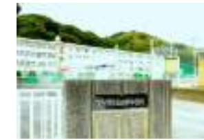
日宇中学校 徒歩26分(約1800m)