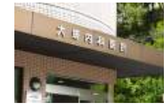
大塔内科医院 徒歩8分(約640m)