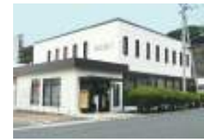
親和銀行卸本町支店 徒歩8分(約610m)