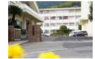
佐世保南高等学校 徒歩19分(約1500m)