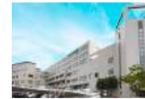
佐世保中央病院 車5分(約2200m)