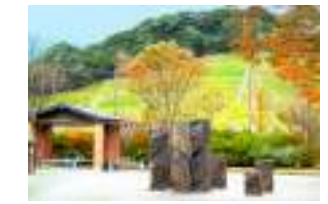
もみじが丘中央公園 徒歩12分(約910m)

■イオン佐世保白岳店/車3分(約1700m) ■佐世保プラザスポーツセンター/徒歩7分(約530m) ■大塔公園/車4分(約1900m)