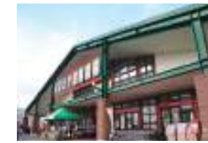
まるたか生鮮市場 車3分(約1800m)