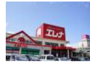
エレナショッピングセンター 車4分(約1600m)