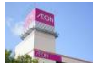
イオン大塔ショッピングセンター 車3分(約1400m)