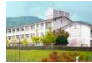
大塔小学校 徒歩15分(約1200m)