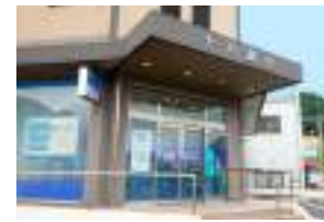
十八銀行大塔支店 徒歩4分(約310m)