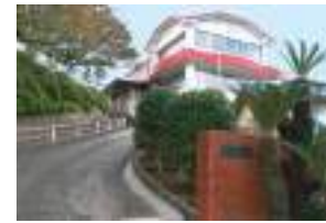
さつき幼稚園 徒歩13分(約1000m)